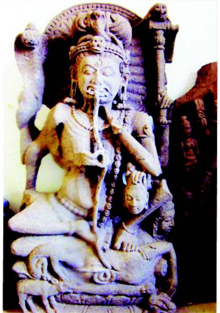
चित्र 26.6: चामुण्डा