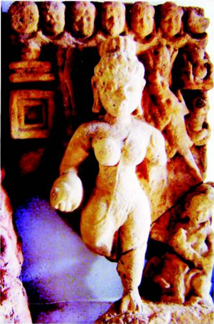
चित्र 26.5: गौरी