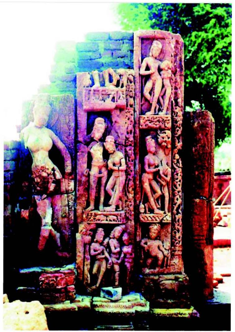
चित्र 26.2: महातीवरदेव विहार सिरपुर बाँयी द्वारशाखा