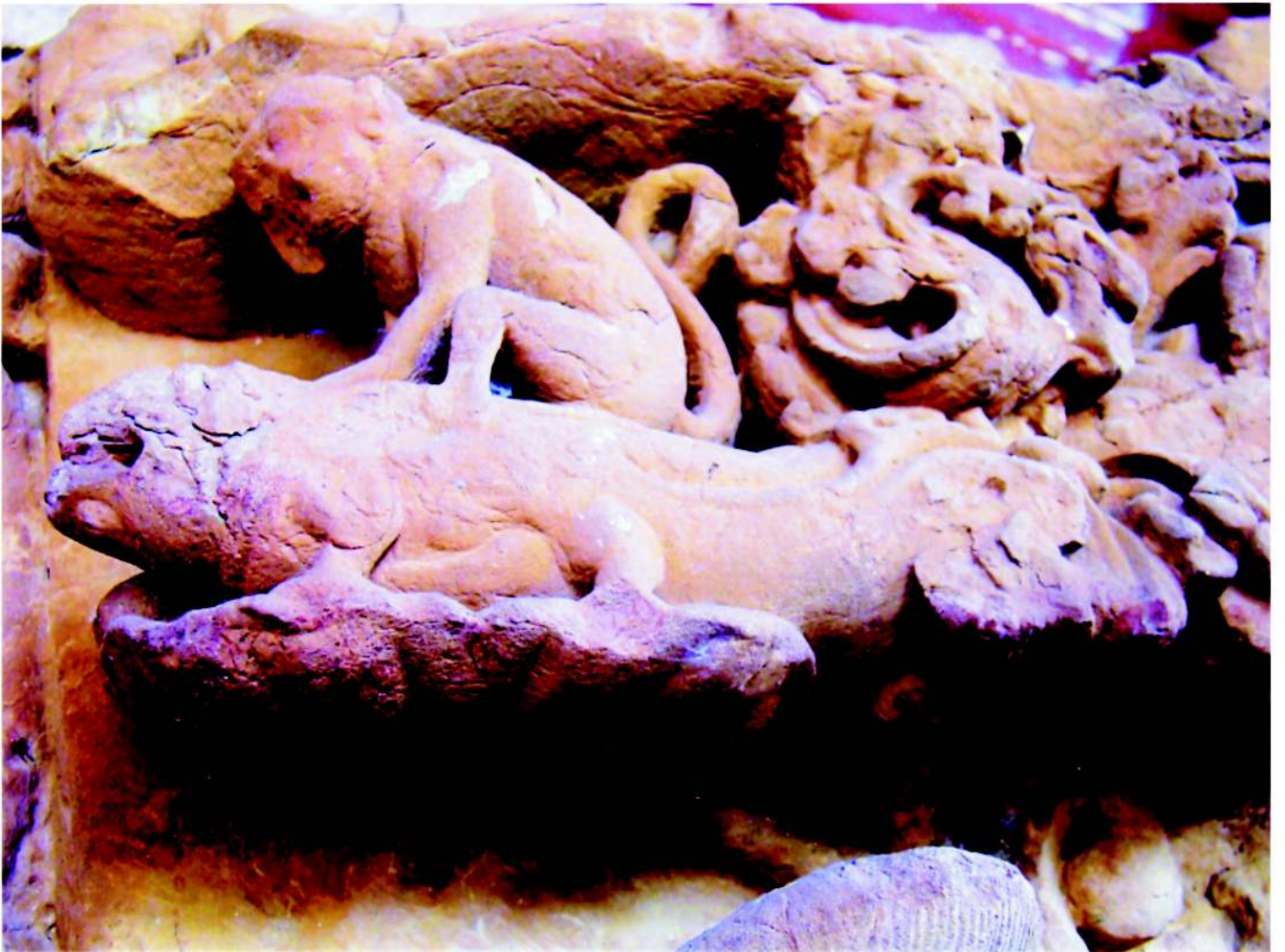
चित्र 26.3: मकरारूढ वानर